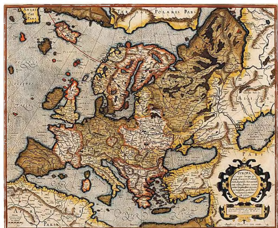
Χάρτης της Ευρώπης, του 1595, από τον διάσημο γεωγράφο και χαρτογράφο Gerardus Mercator.

Το απόσπασμα που ακολουθεί έχει ληφθεί από το κεφάλαιο για την Ευρώπη – και προϋποθέτει ότι η ήπειρος στην οποία ανήκουμε ζει την παρακμή της και το έλλειμμα νοήματος. Το κείμενο τυπώνεται σε πολυτονικό, όπως και το βιβλίο που θα κυκλοφορήσει σε λίγες μέρες.