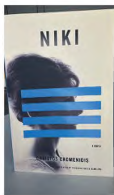
Η αγγλόφωνη έκδοση του βιβλίου από τον Other Press.