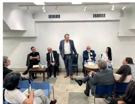
Ο συγγραφέας στην εκδήλωση της Νέας Υόρκης, όπου μίλησε σε ομογενείς.