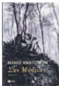
ΜΑΝΟΣ ΚΟΝΤΟΛΕΩΝ Σαν Μήδεια Μυθιστόρημα Σελ. 144 ΕΚΔΟΣΕΙΣ ΠΑΤΑΚΗ, 2023

Με γραφή λυρική και γλώσσα ρυθμική που συχνά εμπλουτίζεται και με λέξεις αρχαϊκές συγκροτώντας στο σύνολο έναν λόγο αισθητικά και εννοιολογικά ενιαίο, αμφισβητεί τόσο τη γυναικεία όσο και την αντρική εικόνα –όπως αυτές διαμορφώθηκαν και παγιώθηκαν διαχρονικά κάτω από συγκεκριμένες κοινωνικές και πολιτισμικές αντιλήψεις και συγκυρίες–, και μακριά από κάθε στείορο πολιτικό και ιστορικό διδακτισμό προσβλέπει στην πραγματική φύση των δύο φύλων