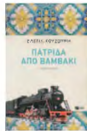
ΕΛΕΝΑ ΧΟΥΖΟΥΡΗ Πατρίδα από βαμβάκι ΕΚΔΟΣΕΙΣ ΠΑΤΑΚΗ

Βεβαίως, στο βιβλίο υπάρχει και η άλλη πλευρά, της οικογένειας του Στέργιος Χ. στην Ελλάδα, που δεν είναι αριστερή, μένει