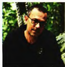
Μπλε ήπιος, μυθιστόρημα, εκδ. Μεταίχμιο.

Ο ΠΙΟ ΣΥΝΤΟΜΟΣ δρόμος για να φτάσεις στην καρδιά είναι ο ορίζοντας. Θα συμφωνήσω με τον Ρικάρντο Ρέις του Ζοζέ Σαραμάγκου. Χρειάστηκε να φτιάξω έναν μπλε ήλιο για να στεγάσω τους ήρωες του μυθιστορημάτος μου. Εν συντομία: ένας άντρας πέφτει στο δρόμο από εγκεφαλικό, ένας άντρας τον βρίσκει και τον πηγαίνει στο νοσοκομείο, μια γυναίκα μαθαίνει τα άσχημα νέα για τον άντρα της. Μεσολαβούν δεκαπέντε ημέρες ως το μοιραίο. Ικανές για να βγουν στην επιφάνεια όλα τα αποκαθλωμένα όνειρα, οι στομωμένες ελπίδες και ο αδικαίωτος πόθος της αγάπης. Κεντρική ηρωίδα είναι η Μαριάννα. Μια γυναίκα που δεν κατάφερε ποτέ να ορίσει τη ζωή της και τώρα που το επιζητάει είναι πολύ αργά. Η αγάπη είναι η ζώνη που δένει και τους τρεις ήρωες, τους σφίγγει την καρδιά και το σώμα. Ολοένα και περισσότερο τα τελευταία χρόνια προσπαθώ να εσιτάσω στο πιο μέσα των ηρώων, το αδύλωτο, το αφανέρωτο. Δεν είναι εύκολο να ξύνεις και να ξύνεις, αλλά δεν υπάρχει άλλος τρόπος.