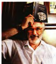
Όρες αιώρες, διηγήματα, εκδ. Κέδρος.

ΑΠΟ ΤΗ ΧΑΡΑΥΤΗ του 20ού αιώνα μέχρι τις σημερινές, δυσοπικές, ημέρες, άνθρωποι σε κρίσιμες ώρες του βίου τους. «Όρες» που συχνά τους συνδέουν με κρίσιμες ιστορικο-κοινωνικές στιγμές της εποχής τους ή σημαντικά γεγονότα της περιοχής τους. Η δράση διαδραματίζεται κυρίως εντός μιας πόλης του ελληνικού Βορρά ή πέριξ αυτής.