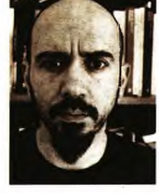
Η πλώ των πουλιών, αφήγημα, εκδ. Ποταμός

ΤΟ ΤΡΙΤΟ ΜΟΥ ΒΙΒΛΙΟ , «Η πλώ των πουλιών», είναι ένα ημερολόγιο θανάτου: Αρχές Δεκέμβρη. Ο πατέρας μου μόλις είχε αρρωστήσει. Ο γιατρός καθαρόγραφε σε ένα χαρτί όσα όφειλε να θυμάται – όργανα, διαμέτρους, φάρμακα. Το βλέμμα μου έπεσε σε μια παρατήρηση στην κορυφή της σελίδας: Ο καρκίνος είναι ορατός με γυμνό μάτι, θυμίζει ανοικτό σμήνος αστέρων. Χρησιμοποιώντας την ασθένεια ως φόντο, καταπιάστηκα με τη σχέση πατέρα και γιου.