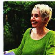
Vor. Πέρα από τον Νόμο, μυθιστόρημα, εκδ. Μεταίχμιο

ΕΙΝΑΙ ΕΝΑ ΜΥΘΙΣΤΟΡΗΜΑ για τη ρωσόφωνη μαφία που απλώνεται στην Ευρώπη. Αφορά τους Vory V Zakone (Κλέφτες με Κώδικα), μια εγκληματική οργάνωση που