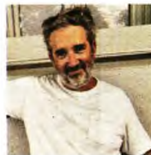
Αφαίκα & Τελαμόνος, διηγήματα, εκδ. Μεταίχμιο

ΓΡΑΦΟΝΤΑΙ τα διηγήματα που συναρπάζουν τούτο το βιβλίο ξαναβρήκα τη χαρά του παιχνιδιού της λογοτεχνίας: τους πειραματισμούς με τη φόρμα, την υπονόμηση των προσδοκιών του αναγνώστη, τα φερτά υλικά της ζωής που αναδίνουν νέες σημασίες αν τα βάλλεις σε μια νέα διάταξη. Αρκετές από τις ιστορίες ή τις καταστάσεις που εκθέτω δεν είναι επινοημένες, απλώς τις φιλοξενώ και τις βοηθάω να ακουστούν, να βρουν μια πιο στέρεη θέση. Δοκίμασα τις δυνάμεις μου στη μεγάλη πύκνωση, να πω δηλαδή μια ιστορία με τα λιγότερα δυνατά μέσα διατηρώντας ανέπαφο το συγκινησιακό φορτίο που τη γέννησε. Αυτό είναι το φωτεινό μήνυμά αυτής της συλλογής: ότι οι όμορφες ιστορίες διασώζονται ακόμη κι όταν όλα γύρω τους καταρρέουν.