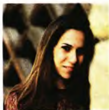
Τι είναι ένας κάμπος, μυθιστόρημα, εκδ. Πόθις

ΤΟ 1946 ατμόπλοια γεμάτα με Εβραίοι επιζώντες του Ολοκαυτώματος, που κατευθύνονται προς την Παλαιστίνη, ανακόπτονται και οδηγούνται από τους Άγγλους στην Κύπρο. Κάπως έτσι ξεκινά η ιστορία των στρατοπέδων της Αμμοχώστου – των camps που οι Κύπριοι έπαιναν «κάμπους», όπου μέχρι το 1949 θα φιλοξενηθούν περίπου πενήντα χιλιάδες άνθρωποι και θα γεννηθούν σχεδόν δύο μισοί χιλιάδες παιδιά.