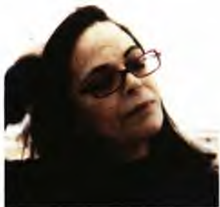
Ανάπτυγμα Βατράκου, νουβέλα, εκδ. Στέρεωμα.

ΕΙΜΑΣΤΕ ΕΝΕΡΓΟΥΜΕΝΑ της νευροφυσιολογίας μας ή μήπως η ανθρώπινη βούληση μπορεί και βουνά να κουνήσει; Σε μια εποχή που η πρωτοβουλία, η ανησυχία και το ρίσκο έχουν αντικατασταθεί από αρχαϊκές ορμές, κανόνισα ραντεβού στον Γιον Γκάμπριελ Μπόρκιαν, τον ονειροπαρμένο καπιταλιστή του Ιψεν, με τους δαιμόνιους Υδραίους ναυτικούς του Καρκαβίτσα, για να μου πουν το μυστικό ή να με μπλέξουν ακόμα περισσότερο. Τόπος συνάντησης η θάλασσα, είτε αυτή είναι ο Βόρειος παγωμένος ωκεανός, είτε τα ζεστά νερά της Μεσογείου, είτε τα μαύρα νερά του Τάμεση στα χρόνια της πρώτης άνοιξης του