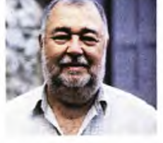
Ο κήπος των ψυχών, νουβέλα, εκδ. Εστία.

ΣΤΟ «ΠΕΤΡΙΝΟ 8» πρωταγωνιστές είναι ο τόπος. Και οι τρεις μόνιμοι κάτοικοί του: η Χελώνα που θέλει να διασχίσει το γκρεμισμένο γεφύρι, ο Αετός που ασταμάτητα διαγράφει οκτάγρια στον αέρα και ο Ύψις που ισχυρίζεται πως αυτός έδωσε το μήλο στην Εύα. Βλέπουν μέσα στα χρόνια να περνούν από εκεί ο σαλεμένος λαϊκός ζωγράφος Θεόφιλος, Μικρασιάτης πρόσφυγας, ένας ανάρτης του Εμφυλίου που έχασε το δρόμο του, τα φασιστάκια του Μεταξά να κατασκηνώνουν και επί απριλιανής χούντας να γίνεται