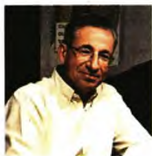
Περί της εαυτού ψυχής, μυθιστόρημα, εκδ. Πατάκι.

ΔΙΑΔΡΑΜΑΤΙΖΕΤΑΙ στο Βυζάντιο και συγκεκριμένα στα τέλη του 11ου αιώνα την εποχή των πρώτων Κομνηνών. Ο βασικός χαρακτήρας του βιβλίου, αντιγραφείας χειρογράφων και αυλικός νοτάριος, στο τέλος της μακρόχρονης ζωής του ξαναπιάνει τη γραφίδα καθώς θέλει να αποτινάξει από πάνω του τον ρόλο του εντολοδόκου