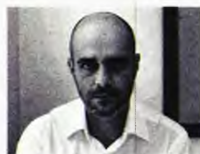
Εννέα, μυθιστόρημα, εκδ. Ικαρος

ΤΟ 2014 άρχισα να μελετώ το έργο του Λεοντίου Μαχαιρά «Εξήγησις της γλυκείας χώρας Κύπρου», η οποία λέγεται Κρόνακα, τουτέστιν Χρονικόν, ως πυξίδα για μια δική μου εργασία, με γενικό τίτλο «Νέα Κρόνακα», που θα περιέχει τριάντα τρία επιμέρους μυθιστορήματα. Προς το παρόν, μόνο ένα έχει εκδοθεί, η «Κρόνακα» (Ικαρος, 2017), διότι όσα άλλα πρόλαβα να γράψω προσέκρουσαν σε ποικίλα αδιέξοδα, αισθητικά και (κυρίως) οντολογικά. Το 2020, προσπαθώντας να ξεπεράσω αυτές τις δυσκολίες, θυμήθηκα ότι το έργο του Μαχαιρά, αντίθετα με τα περισσότερα χρο-