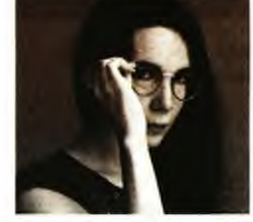
Ήσυχια να πας, νουβέλα, εκδ. Κόλη

ΑΝΤΛΩΝΤΑΣ τον τίτλο της από τον στίχο του Ντίλαν Τόμας «μη στέργεις ήσυχια να πας σε νύκτα ευλογημένη», η νουβέλα μου κινείται στην επικρασία της επιστημονικής φαντασίας. Σε τριτοπρόσωπη αφήγηση αυτή τη φορά, παρακολουθεί την Ολβία και τον Θάνο από τη στιγμή της άφιξής τους στον πλανήτη Γκίτζε. Στην τεχνολογικά εξελιγμένη αποικία του Εσπερου, που είναι χτισμένη μέσα σε οργαστική βλάστηση, συμβιώνουν αρμονικά άνθρωποι από τον παλιό κόσμο, μαζί με προϊστορικά ζώα και ανθρωποειδή. Παρά το κλίμα χαράς και ευφορίας που φαίνεται να διακατέχει τους κατοίκους, η Ολβία είναι μελαγχολική και απούσα. Η συνάντηση με τον από χρόνια χαμένο θείο της, αλλά και η καταβύθιση στον πυθμένα των μυστικών υπόγειων λουτρών, θα τη φέρουν αντιμέτωπη με περίεργα οράματα, με ανδρώπους και τόπους άγνωστους. Θέλησα να γράψω μια νουβέλα αισιόδοξη, για τη μνήμη, τη λήθη και τις δεύτερες ευκαιρίες, για τους ωσεί απόντες αυτού του κόσμου.