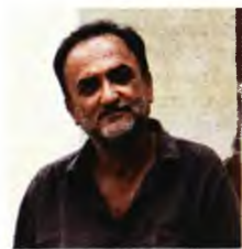
Το μαύρο φόρεμα του κόρακα, διηγήματα, εκδ. Αγρα

ΕΠΤΑ ΙΣΤΟΡΙΕΣ που ταξιδεύουν τον ίδιο τόπο, τον περιγράφουν αλλά δεν τον κατονομάζουν. Ιστορίες που περιηγούνται τον χώρο της μνήμης καθώς αυτή αρχίζει να εξασθενεί, να χάνεται σχεδόν και έτσι αναγκάζεται ο αφηγητής τους να κτίζει πάνω στα χαλάσματα και τα συντρίμια των παλιών πραγματικών γεγονότων, να επινοεί φανταστικές ιστορίες ως αντιστάθμισμα αυτής της απόλλειας. Με τα παλιά υλικά προσπαθεί να φτιάξει νέες ιστορίες, αλλά το ξάφνιασμά του είναι μεγάλο όταν πάνω σε αυτά που έχει επινοήσει σκοντάφτουν όλα εκείνα που έχουν συμβεί και αδυνατεί να τα ξεχωρίσει.