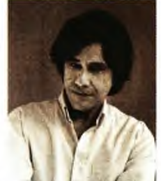
Το ψευκό δωμάτιο, μυθιστόρημα, εκδ. Καστανιώτη.

ΟΙ ΧΑΡΑΚΤΗΡΕΙ των βιβλίων, των διηγημάτων και των θεατρικών έργων συλλαμβάνονται από τους δημιουργούς τους και ζουν τη ζωή τους στη σελίδα και στη σκηνή. Οι πιο σημαντικοί από αυτούς ζουν εσαεί στη ψυχή των αναγνωστών και των θεατών τους. Τι γίνεται όπως με τα ίδια αυτά τα πλάσματα της φαντασίας, τα ανύπαρκτα, των οποίων η ζωή δεν υπάρχει πάρα στο μυαλό του συγγραφέα, του «Νονού» τους; Πού πάνε οι χαρακτήρες αυτοί, όταν ο συγγραφέας που τους έχει επινοήσει παραδίδει το βιβλίο, το θεατρικό έργο, πού πάνε όταν τελειώνει η ανάγνωση, η παράσταση; Θεωρώ πως μεταφέρονται σε ένα είδος καταφυγίου-κάστρου. Σε μια αχανή Πανσιόν. Ως Νονός κι εγώ του βιβλίου μου παρακολουθώ την έλευση της Εντα Γκάμπλερ η όποια καταφθάνει στην Πανσιόν που διευθύνει η κυρία Φλόρα με τα εφόδια που την έχει προικίσει ο συγγραφέας-Νονός της Ερρίκος Ιβεν.