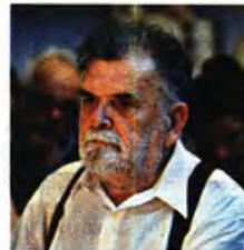
Στα χρόνια του κόκκινου Κόμ, διηγήματα, Εκδόσεις Καστανιώτη.

ΤΟ ΔΙΗΓΗΜΑΤΑ αναφέρονται σε μια πολυεθνική ομάδα φοιτητών, κατά την περίοδο της μεγάλης οικονομικής και επιστημονικής κρίσης του ρουμανικού κομμουνισμού. Η ομάδα αυτή διαμορφώνεται στα δυο εβδομημερή στέκια της νεολαίας εκείνης της εποχής στο Κλουζ στην «Αριζόνα» και στον «Κρόκο». Η δράση της καταγράφει τον αγώνα για την εξασφάλιση τροφίμων, στον οποίο είχε επιδοθεί και ολόκληρος ο ρουμανικός λαός. Η δράση αυτών των νέων καταρρίπτει τον μύθο του ολοκληρωτικού καθεστώτος ότι έχει εξαλείψει τις κοινωνικές ανισότητες δημιουργώντας τις προϋποθέσεις για μια ευτυχισμένη κοινωνία. Αν στην προηγούμενη συλλογή διηγημάτων μου («Ο θάνατος του αστήριτη και άλλες ιστορίες») κυριαρχεί η μνήμη και η γλώσσα του γενέθλιου τόπου, εδώ κυριαρχεί ο χώρος και το βλέμμα της ενηλικίωσης και σπουδών μου (Κλουζ – μια παλιά τρανσυλβανική πόλη, όπου βρέθηκα για σπουδές το 1978 κι έζησα εκεί για πέντε χρόνια).