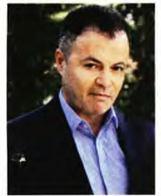
Ιχνη στα όνειρα, μυθιστόρημα, εκδ. Βακχικών

ΕΙΝΑΙ ΜΙΑ ΙΣΤΟΡΙΑ που θα μπορούσε να μη θεωρηθεί καν μυθολογία, περισσότερο ένας σκληρός ρεαλισμός πέρα από ένα μυθιστόρημα του φανταστικού, που αφηγούνται σε πρώτο πρόσωπο οι επτά πρωταγωνιστές της. Όμως, κάθε φορά, η συνειδηση του προηγούμενου ξυπνά στο σώμα του επόμενου και σταδιακά γίνεται ο άλλος, αυτός που δεν εννοούσε, ο ξένος που σκότωσε. Ο πατέρας δεν συμφιλώθηκε με τον ομοφυλόφιλο γιο του, ο γιος που προδόθηκε από τον διευφυλικό εραστή του, ο κυνηγός αλλοδαπός φίλος του διευφυλικού, ο νεαρός αστυνομός που τον συνέλαβε, ο