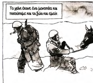
Το χιόνι έκανε ένα μονοπάτι και πατούσαμε και τα ζώα και εμείς μέχρι τον τελικό προορισμό, τα βραχώδη βουνά, η αβεβαιότητα, ο φόβος καταγράφονται σχετικά αποστασιοποιημένα λόγω του χρόνου που έχει περάσει αλλά κυρίως λόγω των όσων θα ακολουθήσουν. Γιατί τον Δεκέμβριο του 1940 οι φαντάροι αρχίζουν τις μάχες σώμα με σώμα, σφαίρες και οβίδες σφυρίζουν πάνω απ' τα κεφάλια τους.

Δεν ήταν ασκήσεις πια, αλλά πόλεμος. Αντιπεθήσεις, υποχωρήσεις, έφοδοι, κακουχίες, τραυματίες, νεκροί, «η πρώτη κακιά μέρα της μάχης της 9ης Δεκεμβρίου του 1940». Για τη συνέχεια ο εγγονός Τάσος Ζαφειριάδης, μετά τα τόσα χιουμοριστικά του κόμικς («Σπιφ και Σπαφ», «Ο Κυρ Κονγκ και άλλες Ιστορίες» κ.ά.), τα μυθοπλαστικά του σενάρια με αφορμές πραγματικά γεγονότα ή την ίδια την Ιστορία («Γρα Γρου», «Ψηφιδωτό» κ.ά.), τους κατ' ουσίαν φιλοσοφικούς πειραματισμούς του πάνω στη φύση της τέχνης των κόμικς («Σκορποχώρι»), κάνει μια σπάνια δουλειά που τη διανθίζει με χάρτες, ιστορικά στοιχεία, απομνημονεύματα αρχείων και δεδομένων. Όλα μετά από ενδελεχή μελέτη, μέρος της οποίας παρουσιάζεται στο τέλος του βιβλίου όπου επεξηγούνται πολλές λεπτομέρειες και παρατίθενται φωτογραφίες, ταυτοτήτες, στρατιωτικοί κατάλογοι, φύλλα πορείας, έγγραφα, ακόμα και προσωπικά γράμματα και σημειώματα του παππού Ζαφειριάδη.