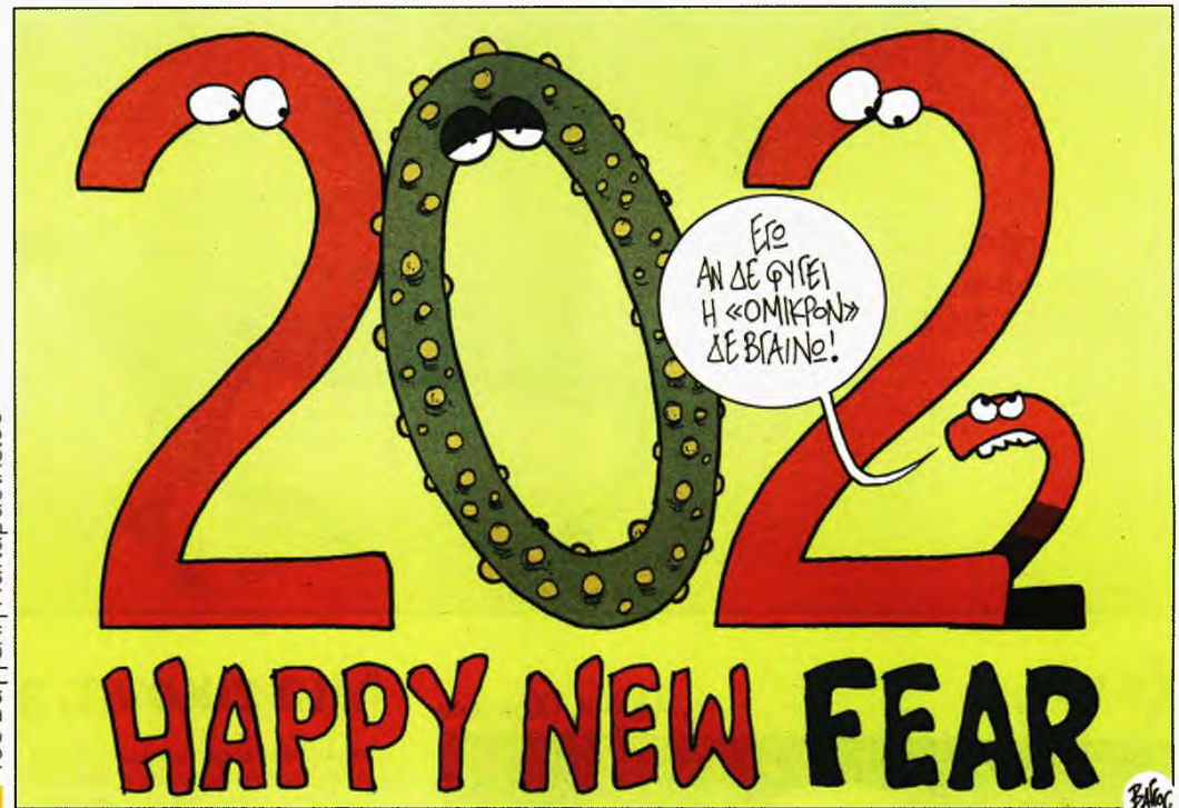
Του Βαγγέλη Παπαβασιλείου