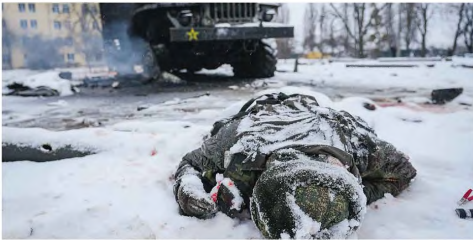
Χάρκοβο, 25 Φεβρουαρίου 2022. Πτώμα Ρώσου στρατιώτη πλάι σε κατεστραμμένο ρωσικό στρατιωτικό όχημα.