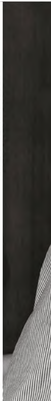
ΑΠΟ ΤΟΝ ΧΡΗΣΤΟ ΠΑΡΙΔΗ