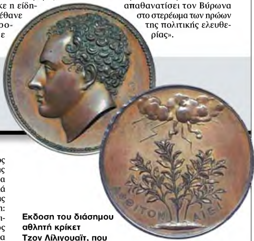
Χάλκινο μετάλλιο του 1824, που κατασκευάστηκε αμέσως μετά τον θάνατο του Βύρωνα από τον χαρακτή και γλύπτη Αλφρεντ Τζόζεφ Στόθαρντ. Στη μία πλευρά εικονίζεται ο ποιητής και στην άλλη τρία κλαδιά δάφνης που τα κτυπά κεραυνός, εκείνα όμως παραμένουν ανέπαφα. Ανάμεσα στα κλαδιά αναγράφεται το ομηρικό «ΑΦΘΙΤΟΝ ΑΙΕΙ!» («Δόξα που δεν φθίνει!»)

ποιητής σε ηλικία δέκα ετών, όταν ανακρίθηκε ως βαρόνος Μπάιρον του Ρότοντεϊλ. Το Νιούστεντ Αμπι χτίστηκε περί το 1163 ως μοναστήρι του Τάγματος του Αγίου Αυγουστίνου, με διαταγή του βασιλιά Ερρίκου Β'. Βρίσκεται στην καρδιά του δάσους Σέργουντ, στο οποίο, κατά τον θρύλο, κατοικούσε ο Ρομπέν των Δασών. Το 1540, έναν χρόνο μετά τη διάλυση του μοναστηριού, ο Ερρίκος Η' το παραχώρησε στον σερ Τζον Μπάιρον, πρόγονο του ποιητή, ο οποίος το μετέτρεψε σε εξοχική κατοικία. Εκεί, ο Βύρων εξασκούσαν στη σκοποβολή κουβαλώντας μαζί του, ως απαραίτητο αξεσουάρ, την πυριτιδόθηκα του, την οποία ο συλλέκτης Ντίους Νοταράς αγόρασε πριν από τέσσερα χρόνια σε δημοπρασία στο Λονδίνο. Προηγουμένως, ανήκε στον Χάρολντ Ουόρντ, διάσημο συλλέκτη βυρωνικών αντικειμένων. «Ήρουν πολύ τυχερός που μπόρεσα να αποκτήσω αυτή τη σπάνια παλάσκα. Ευτυχώς, ο οίκος που τη δημοπρατήσε παρέλειψε να προσθέσει τη φωτογραφία της στον κατάλογο της δημοπρασίας. Όλα τα υπόλοιπα αντικείμενα πουλήθηκαν σε αστρονομικές τιμές σε πλούσιους συλλέκτες. Αν αυτοί είχαν αντιληφθεί την ύπαρξη της μαρπουτοθήκης, δεν θα κατάφερα να την κάνω δική μου», δηλώνει στα «ΝΕΑ» ο 77χρονος συλλέκτης, ο οποίος άρχισε να αποκτά αντικείμενα που σχετίζονται με την Ελληνική Επανάσταση από τη δεκαετία του 1960. Στη συλλογή του Νοταρά περιλαμβάνεται ένα πορτρέτο - μινιατούρα του