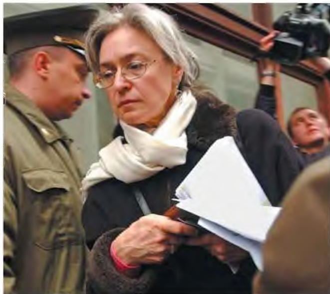
Πούτιν Μόσχα

Σημαντικό μέρος του βιβλίου της Γκέσεν αφιερώνεται στην προσπάθεια σκιαγράφησης του χαρα-