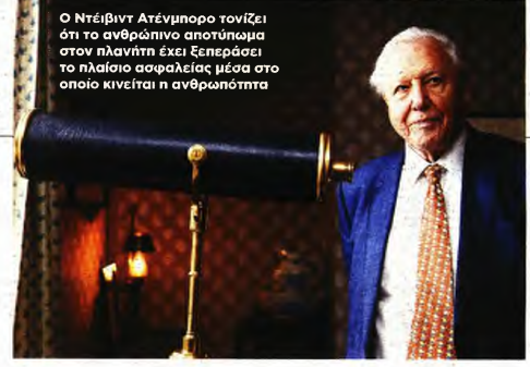
Ο Ντέιβιντ Ατένμπορ τονίζει ότι το ανθρώπινο αποτύπωμα στον πλανήτη έχει ξεπεράσει το πλαίσιο ασφαλείας μέσα στο οποίο κινείται η ανθρωπότητα