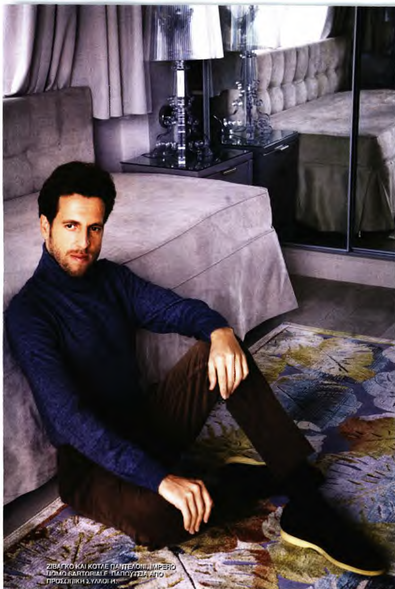
ΖΙΒΑΓΚΟ ΚΑΙ ΚΟΤΛΕ ΠΑΝΤΕΛΟΝΙ, ΙΜΠΕΡΟ ΠΟΜΟ SARTORIALE F. ΠΑΠΟΥΤΕΙΑ ΑΠΟ ΠΡΟΣΩΠΙΚΗ ΣΥΛΛΟΓΗ.