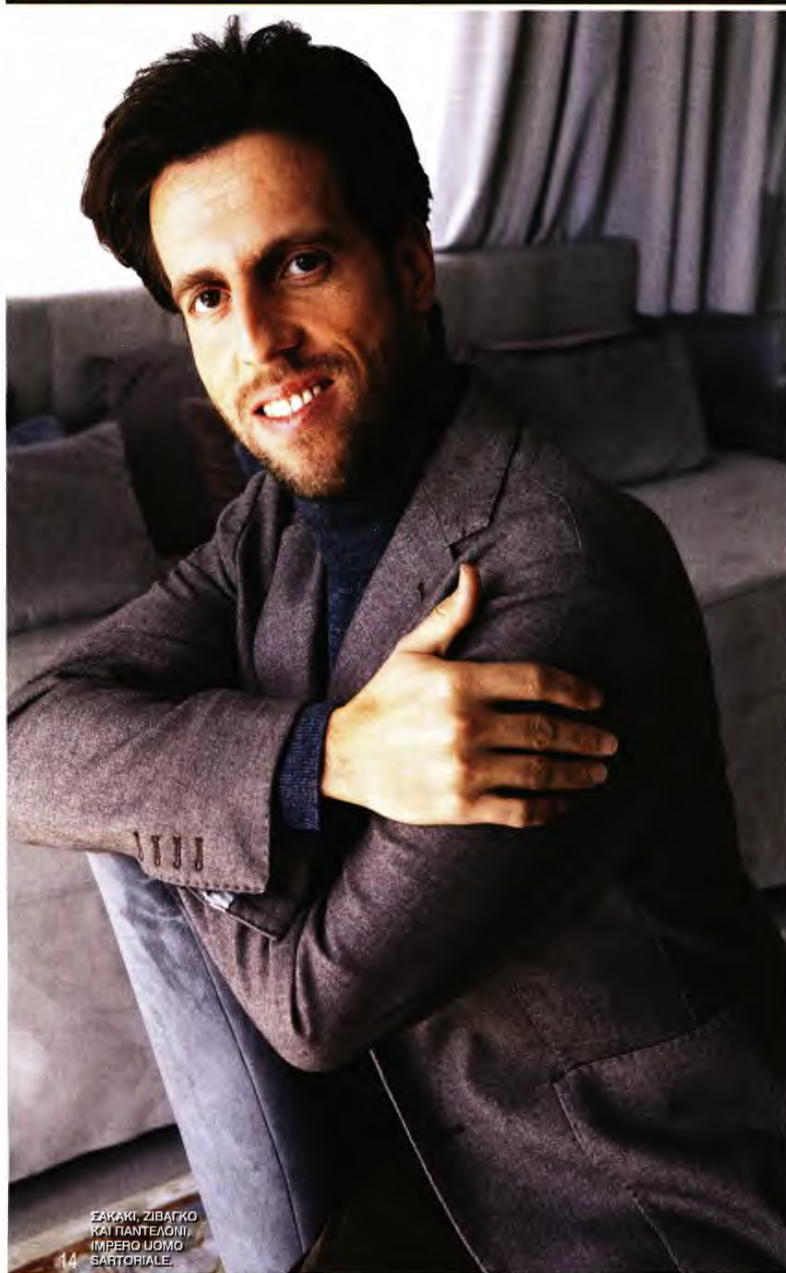
ΕΡΑΚΛΙ, ΖΙΒΑΓΚΟ ΚΑΙ ΠΑΝΤΕΛΟΝΙ, IMPERO UOMO SARTORIALE.

Δ ηλώνει ότι ως σκηνοθέτης στόχος του είναι να κάνει όμορφα πράγματα με όμορφους ανθρώπους. Κι ένα από τα όμορφοτερα πράγματα που έχει κάνει ο Τομ Βολφ είναι η ενασχόλησή του με τη Μαρία Κάλλας μέσα από μία ταινία, ένα βιβλίο, μία παράσταση και δύο projects στο Παρίσι και στην Αθήνα για τη ζωή της κορυφαίας υψιφώνου.