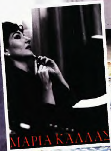
Τα «Γόρμητα και αναμνήσεις» (εκδ. Πατάκη) είναι, σύμφωνα με το συγγραφέα τους, ένα βιβλίο για την Κάλλας που μοιάζει να έχει γραφτεί από την ίδια.

«Ήθελα να παρουσιάσω την Κάλλας όπως πραγματικά ήταν και όχι όπως πίστευε ο κόσμος ότι ήταν και να γίνει κατανοητή η σύνδεση ανάμεσα στην καλλιτέχνη και τη γυναίκα, την Κάλλας και τη Μαρία»