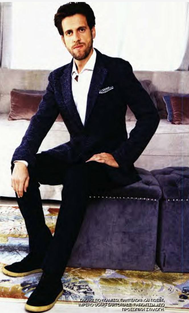
ΣΤΑΥΡΟΣ ΠΟΥΚΑΜΙΣΟΣ, ΠΑΝΤΕΛΟΝΙ ΚΑΙ ΠΟΞΕΤ, IMPERIO UOMO SARTORIALE, ΠΑΡΟΧΕΥΣΙΑ ΑΠΟ ΠΡΟΣΩΠΙΚΗ ΣΥΛΛΟΓΗ.

Πού θα στεγαστεί το μουσείο στο Παρίσι; Ελπίζουμε πολύ κοντά στο διαμέρισμά της. Έχετε επισκεφθεί το μέρος όπου έζησε η Μαρία Κάλλας στην Αθήνα; Εννοείται πως ναι! Αν και γεννήθηκε στη Νέα Υόρκη, έζησε στην Αθήνα για αρκετά χρόνια και σε όλη τη διάρκεια του πολέμου. Επέστρεψε στην Ελλάδα για να τραγουδήσει στο Ηρώδειο το 1957 και στην Επίδαυρο το 1960. Το να έρχομαι λοιπόν στην Ελλάδα είναι σαν να επισκέπτομαι το σπίτι της. Νιώθω όμως και στο Παρίσι ότι είμαι στο σπίτι της αφού έζησε εκεί για πενήντα χρόνια. Ποια είναι η σχέση η δική σας με την Ελλάδα; Πώς αισθάνεστε εδώ; Έχω μια πολύ ξεχωριστή σχέση με τους Έλληνες. Την πρώτη φορά που ήρθα στη χώρα σας, το 2016, για να προετοιμάσω την ταινία, ήμουν τυχερός γιατί γνώρισα κάποιους στενούς φίλους της Κάλλας που με βοήθησαν πολύ. Στη συνέχεια, ήρθα ξανά το 2018 για να παρουσιάσω το φιλμ, το οποίο έτυχε θερμής αποδοχής. Αισθάνθηκα μεγάλη τιμή από τον τρόπο με τον οποίο οι Έλληνες αγκάλιασαν τη δουλειά μου. Επέστρεψα τον Σεπτέμβριο με τη Μόνικα στο Ηρώδειο, όπου πάλι ένιωσα μεγάλη τιμή από την υποδοχή του κό-