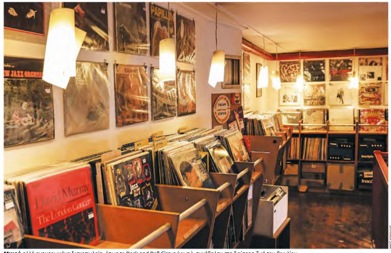
Μικρό αλλά ενθαρμημένο δισκοπωλείο, όπως το Rock and Roll Circus (φωτ.), συνέβαλαν στη δεύτερη ζωή του βινυλίου.

να σου αρέσουν το ίδιο ο Μάρβιν Γκέι και ο Άρτ Γκαρφάγκελ είναι σαν να υποστηρίζεις τους Ισραηλινούς και τους Παλαιστινίους ταυτόχρονα». Ο έρωτας της ζωής του, η Λόρα, τον εγκαταλείπει ξαφνικά και εκείνος ξεκινάει ένα ταξίδι ενθλιπτικής μάχωντας τις παλιές του συντρόφους για να καταλάβει τι κάνει στραβά στη ζωή του. Το βιβλίο εκδόθηκε για πρώτη φορά στα ελληνικά το 1996 από τις εκδόσεις Πατάκι σε μεταφράση της Σοφίας Τριανταφυλλίδου και από τότε εκδόσαν σταθερά για την επόμενη πενταετία και μετά εμφανίστηκε ξανά στην αγορά το 2013. Ο πρώτος κύκλος έκλεισε με πωλήσεις 7.000 αντιτύπων και εννέα χρόνια μετά, τον περασμένο Μάρτιο, κυκλοφόρησε η ένατη έκδοσή του. Τι είναι αυτό που το κάνει κάπως κλασικό; «Είναι κλασικό γιατί ξεκίνησε ως ένα βιβλίο που θα περίμενε κανείς ότι απευθύνεται σε ένα niche κοινό, ότι απευθύνεται στην καρδιά των βινυλιωμένων και κεραιωμένων μουσικολόγων αλλά πέρασε και στην ποι κουλτούρα», μας λέει ο δημοσιογράφος, συγγραφέας και ραδιοφωνικός παραγωγός Θεόδωρος Μίκος με αρκετούς δισκούς στα ράφια της δισκοθήκης του. Σε αυτό το πέρας βολήθηκε βέβαια και η ομώνυμη ταινία, την οποία θεωρεί μια πολύ καλή και πιστή μεταφορά του βιβλίου. «Μεταφέρει ακριβώς το πνεύμα του βιβλίου και δεν πρέπει να ξεχνάμε ότι πριν από τα 20 και πλέον χρόνια από την κυκλοφορία του, το βινύλιο,