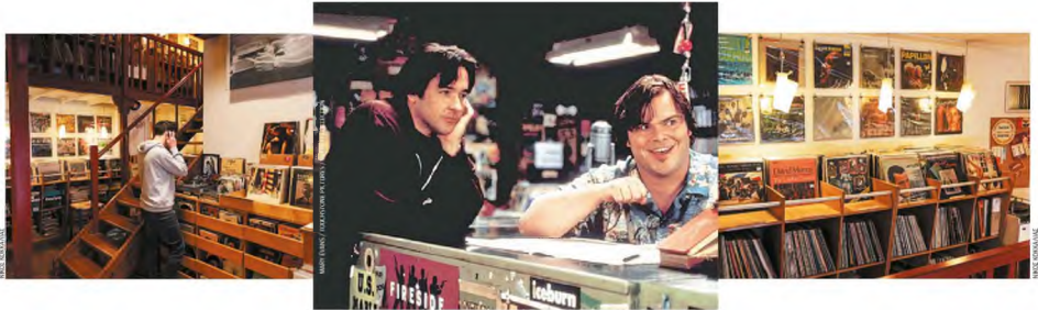
Τζον Κιούζακ και Τζακ Μπλάκ στο κινηματογραφικό «High Fidelity». Η ατμόσφαιρα των δισκοπωλείων ήταν και παραμένει γοητευτική.