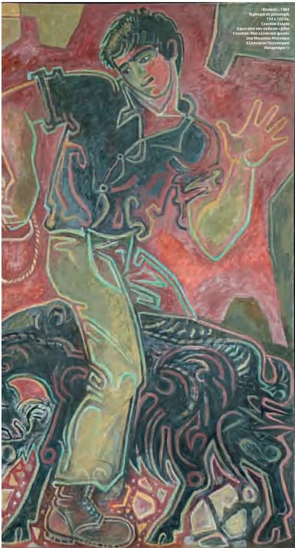
«Βοσκός», 1984 Τέμπρα σε μουσαμά, 154 x 102 εκ. Craxton Estate Έργο από την έκθεση «John Craxton: Μια ελληνική ψυχή» στο Μουσείο Μπενάκη Ελληνικού Πολιτισμού (Κουμπαρή 1)

Ο Τζον Κράττον που γνώρισα είχε μια απλότητα και ευθύτητα, δεν μασούσε τα λόγια του, ό,τι ήθελε να σου πει θα σου το έλεγε ξεκάθαρα, αλλά με έναν τρόπο που δεν θα σε προσέβαλλε. Για αυτό τον ξεχωρίζω. Όμως τον αγάπησα ως άνθρωπο γιατί μου είπε «προχώρα». Θα σας πω τι εννοώ.