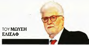
ΤΟΥ ΜΙΩΣΗ ΗΛΙΑΦ

Εκεί όμως που απογειώνεται και ιδιαίτερα στα μάτια ενός γιατρού, είναι η θριαμβευτική μόχη του με την εξάρτηση από το αλκοόλ: «Ο μηχανισμός της εξάρτησης είναι κοινός για όλες τις ουσίες, φυγή από την πραγματικότητα θέλει ο εξαρτημένος, δοκιμάζει τα πάντα κι όποιο του κάτσει, δεν έχει σημασία το είδος». «Διο ποτήρια (κρασί) χαρίζουν υγεία και ανοίγουν τους ορίζοντες, δέκα ποτήρια τους παρανοίγουν». Η απογείωση συνεχίζεται θριαμβευτικά: τη νίκη με το προσωπικό πάθος δεν την κρατά για τον εαυτό του. Οπως άλλωστε και τα αποτελέσματα της επιχειρησιακής επιτυχίας δεν τα ιδιωτικοποιεί. Το προϊόν της επιτυχίας το μοιράζεται και με τους εργαζόμενους, αλλά και με τους κατατρεγμένους. Βοηθάει