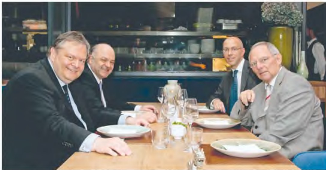
Αριστερά , οι κ. Ευάγγελος Βενιζέλος και Γιώργος Ζανιάς. Δεξιά, ο υπουργός και ο υφυπουργός Οικονομικών της Γερμανίας Βόλφγκανγκ Σόιμπλε και Γεργκ Ασμουςεν. Η φωτογραφία ελήφθη στις 6 Ιουλίου 2011, σε ανεπίσημο δείπνο εργασίας στο Βερολίνο. Στο επόμενο τραπέζι των τεσσάρων δεν υπήρχαν ούτε κάμερες ούτε χαμόγελα...

(...) Με τον Βενιζέλο μοιραστήκαμε τη συνάντηση στο Βερολίνο με τον Σόιμπλε. Διάβαζα στα «Νέα» προχθές στη συνέντευξή του πως