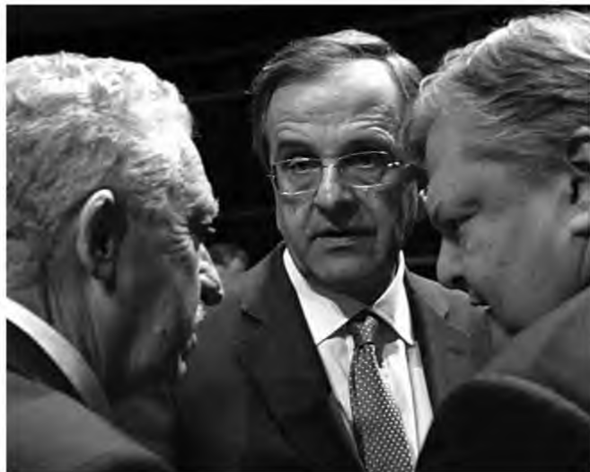
Ευάγγελος Βενιζέλος

Η αβρότητα δεν επιδοξίζει, ωστόσο, την πολιτική κρίση και άρα την πολιτική κριτική. Σε σχέση με τον πρόεδρο του ΠΑΣΟΚ και πρωθυπουργό τα πρώτα χρόνια