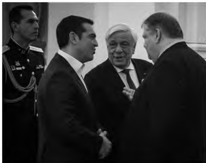
Γιώργος Κονταράκης / Eumakini

12 Φεβρουαρίου 2019, Προεδρικό Μέγαρο, Αθήνα. Ένα από τα ελάχιστα τετα-α-τετ του Ευάγγελου Βενιζέλου με τον πρόεδρο του ΣΥΡΙΖΑ Αλέξη Τσίπρα, υπό το βλέμμα του τέως Προέδρου της Δημοκρατίας Προκόπη Παυλόπουλου, σε δεξίωση της Προεδρίας προς τιμήν του Διπλωματικού Σώματος. Ο Βενιζέλος απαξιώνει σχεδόν συνολικά την κυβερνητική πολιτική Τσίπρα (δεν κάνει αναφορά στις Πρέσπες), θεωρώντας επιπλέον ότι ο ΣΥΡΙΖΑ είναι υπεύθυνος για διολίσθηση των θεσμών, γεγονός που καθιστά το σημερινό κόμμα της αξιωματικής αντιπολίτευσης μια «αριστεροδεξιά εκδοχή ελληνικού ορμπανισμού».