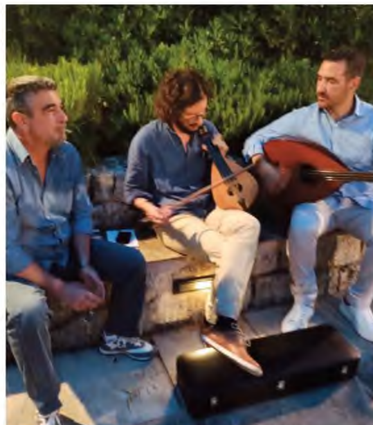
Από την παρουσίαση δεν έλειψαν και τα κασιώτικα όργανα!