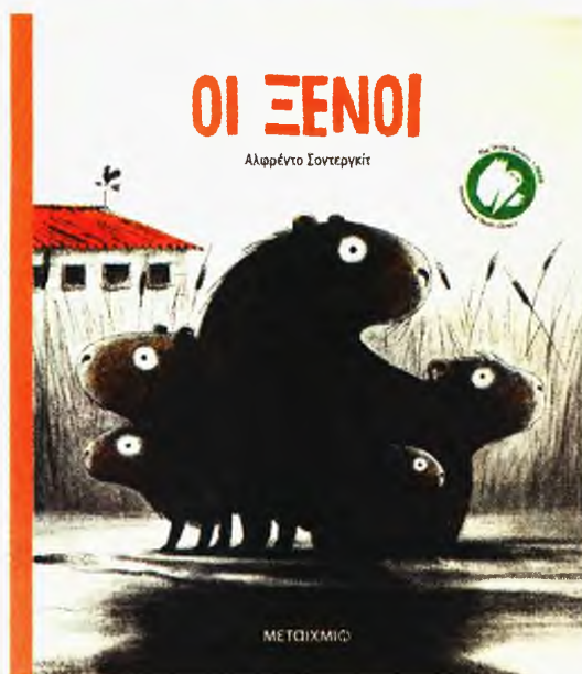
● ΑΛΦΡΕΝΤΟ ΣΟΝΤΕΡΓΚΙΤ Οι Ξένοι ΕΚΔΟΣΕΙΣ ΜΕΤΑΙΧΜΙΟ