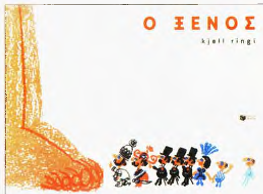
● KJELL RINGI Ο Ξένος ΕΚΔΟΣΕΙΣ ΠΑΤΑΚΗ