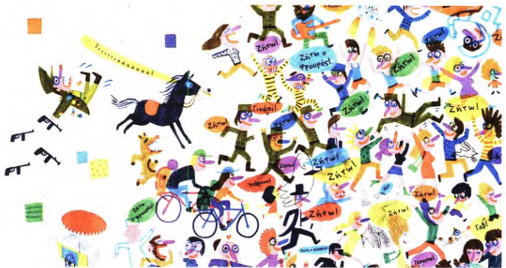
«Μην περάσεις τη γραμμή!»

«Ο ξένος» (5+ ετών, εκδ. Πατάκη, 2022, μτφρ. Carolina Cury, Κωνσταντίνος Δαμιανάκης) του Σουηδού εικαστικού και συγγραφέα Τσελ Ρινγκί (Kjell Ringi, 1939-2010) πρωτοεκδόθηκε το 1968 από τον εκδοτικό Random House. Ήταν ένα μπλε βιβλιάρκι, 36 σελίδων, ένα από τα επτά συνολικά παιδικά εικονογραφημένα βιβλία που δημιούργησε μεταξύ 1967 και 1974 ο Σουηδός. Αυτό που κρατάμε σήμερα στα χέρια μας είναι η πορτογαλική έκδοση (2018), εμφανώς αλλαγμένη, σε ορθογώνιο φορμά και λευκό εξώφυλλο που το κοσμούν τα τεράστια πόδια ενός ξένου και ένας λιλιπούτιος βασιλιάς με την ακολουθία του. Η ιστορία του βιβλίου είναι απλή, σε καμία περίπτωση όμως απλοϊκή: μιλάει για την άφιξη ενός ξένου, που με την παρουσία του και μόνο προκαλεί πανικό στους κατοίκους μιας χώρας όπου ως τότε όλοι ζούσαν ειρηνικά. Οι κάτοικοι μαζί με τον βασιλιά τους θα κάνουν ό,τι περνάει από το χέρι τους για να τον διώξουν. Θα του φωνάξουν, θα στείλουν περιστέρια με απειλητι-