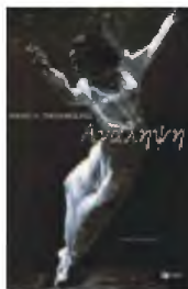
ΗΛΙΑΣ ΠΑΠΑΜΟΣΧΟΣ Ανάλυση Μυθιστόρημα Σελ. 233 ΠΑΤΑΚΗΣ, 2023

Ο Ηλ. Παπαμόσχος, με πολύχρονη θητεία στο διήγημα, περνά στην επικράτεια του μυθιστορηματικού, κατασκευάζοντας πάλι μικρές ιστορίες.