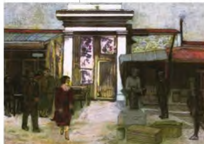
36 LIFO - 15.12.22