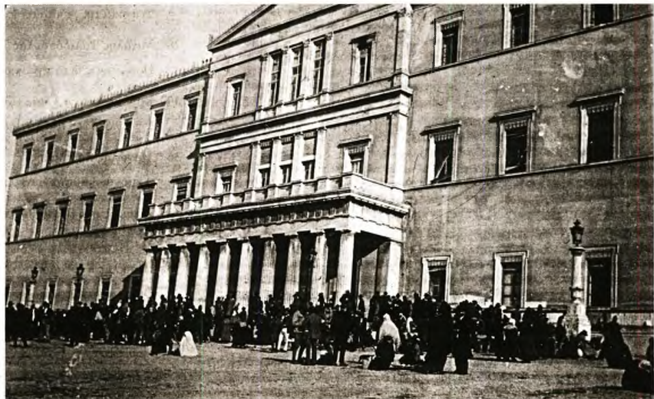
Πρόσφυγες μπροστά από τα παλιά ανάκτορα στην Αθήνα 1922. Τα ανάκτορα κατά την διάρκεια του πολέμου χρησιμοποιήθηκαν ως νοσοκομείο. Μετά, τμήμα τους καταλήφθηκε από πρόσφυγες, ενώ σε άλλο βρίσκονταν τα γραφεία για την ανακούφισή τους. Στο παλάτι πήγαιναν πρόσφυγες κάθε μέρα για να αναζητήσουν συγγενείς και φίλους υπήρχε ένα γραφείο για αυτόν τον σκοπό. Οι πρόσφυγες πήγαιναν επίσης για να παραλάβουν τις ταυτότητές τους με τις οποίες δικαιούνταν βοήθεια.

Η συγκυρία των δύο επετείων έδωσε την αφορμή για μία εντυπωσιακή βιβλιοπαράγωγή. Δεκάδες νέες μελέτες που καλύπτουν διάφορες πτυχές είτε του αγώνα της ανεξαρτησίας είτε της Μικρασιατικής Εκστρατείας κυκλοφόρησαν το 2021 και το 2022. Νέες προσεγγίσεις, αναψηλαφήσεις, επαναξιολογήσεις, αλλά ακόμα και αμφισβητήσεις καθιερωμένων αντιλήψεων συνθέτουν το πανόραμα του γόνιμου δημόσιου διάλογου που αναπτύχθηκε τη διετία που πέρασε. Πλλά στις εκδόσεις, θα πρέπει σπωσήποτε να λογαριάσουμε τα πολυάριθμα συνέδρια και συμπόσια, αλλά και τις εκατοντάδες ημερίδες και διαλέξεις που οργανώθηκαν το ίδιο χρονικό διάστημα και που εξίσου συνέβαλαν στη συζήτηση γύρω από την ελληνική