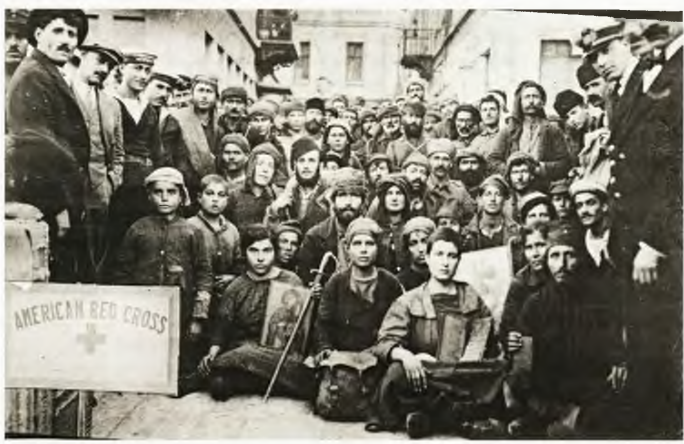
Αυτοί οι χωρικοί της Μικράς Ασίας οδηγήθηκαν στα βουνά κοντά στα σπίτια τους λίγο μετά την καταστροφή της Σμύρνης. Για τρεις μήνες ζούσαν με χόρτα, ρίζες και παρόμοιες τροφές, κάνοντας κατά καιρούς επιδρομές σε κάποιο ελαιώνα τη νύχτα. Τελικά δύο τολμρά μέλη έκλεψαν μια μικρή βάρκα και δραπέτευσαν. Σε όλη την ομάδα τότε παρέχε τροφή και ένδυση ο Αμερικανικός Ερυθρός Σταυρός.

Σε τελική ανάλυση, το βιβλίο επιδιώκει όχι μόνο να δώσει απαντήσεις, αλλά παράλληλα να δημιουργήσει ερωτήματα, πολλά από τα οποία παραμένουν διαρκώς επίκαιρα. «Διαθέτουμε άραγε [οι Έλληνες] τη νηφαλιότητα και την ευθυκρισία στις πολιτικές αποφάσεις;» διερωτάται ο Θάνος Βερέμης. Ο ίδιος, μέσα από τις σελίδες του βιβλίου του, δίνει αρκετά παραδείγματα που μοιάζουν να δικαιώνουν τη στερεοτυπική απάντηση ότι οι Έλληνες κινούνται περισσότερο με βάση το θυμικό παρά με βάση τη λογική. Αυτή, όμως, είναι μόνο η μία όψη του νομισμάτος. Διότι υπάρχουν άλλα, εξίσου ισχυρά παραδείγματα που προκύπτουν από την ανάγνωση του βιβλίου και κατατείνουν σε διαφορετικό συμπέρασμα. Ίσως το πιο χαρακτηριστικό είναι οι επιλογές που έκανε η Ελλάδα μετά τον Β΄ Παγκόσμιο Πόλεμο στον πολύ κρίσιμο (ειδικά για ένα μικρομεσαίας εμβέλειας κράτος) τομέα της εξωτερικής πολιτικής, υπήρξαν κατά τεκμήριο πετυχημένες. Δεν είναι, εξάλλου, τυχαίο το