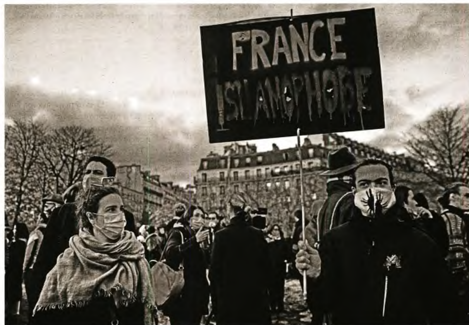
Παρίσι, 21 Νοεμβρίου 2020: Ένας διαδηλωτής κρατά ένα πλακάτ που γράφει «ΓΣΛΑΜΟΦΟΒΙΚΗ ΓΑΛΛΙΑ» κατά τη διάρκεια μιας διαδήλωσης ενάντια στο νομοσχέδιο της γαλλικής κυβέρνησης για την ασφάλεια και τους περιορισμούς που αφορούν τις μουσουλμανικές κοινότητες. Ο μουσουλμανικός πληθυσμός της Γαλλίας με 3,7 εκατομμύρια αποτελεί τη μεγαλύτερη μουσουλμανική κοινότητα στη Δυτική Ευρώπη. Μια σειρά τρομοκρατικών επιθέσεων τα τελευταία χρόνια ανάγκασε τη γαλλική κυβέρνηση να θεσπίσει νέους νόμους σε μια προσπάθεια καταστολής του ριζοσπαστικού Ισλάμ.

Η αρένα της ταξικής πάλης συμπληρώθηκε με νέα αγωνίσματα –φεμινισμός, α-ποσποικιοποίηση, αντιρατσισμός– και τα κριτήρια εντοπισμού των εχθρών άλλαξαν. Μια ακόμα «Οκτωβριανή Επανάσταση» έσβησε από το φανταστικό των αγωνιστών (με εξαίρεση το ΚΚΕ). Υποτροπίασε όμως το σύνθημα του Μάη του '68: «Να είστε ρεαλιστές, επιδιώξτε το αδύνατο!» Κι όπως ξέρομε από την εποχή του Λένιν και του Στάλιν, απαιτείται άπειρη βία για να αναγκάσεις τους ανθρώπους να κάνουν κάτι που είναι αδύνατο. Με φωνικές κορυφώσεις σε πράξεις τρομοκρατίας, οι καθημερινές συγκρούσεις διατηρούνται ηπιότερες στον δυτικό κόσμο, αλ-