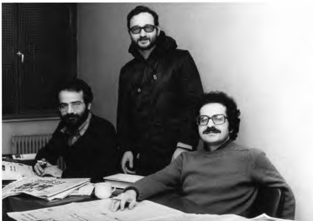
Ο Μίμης Ανδρουλάκης με τον Αλέκο Αλαβάνο και τον Παναγιώτη Λαφαζάνη, χρόνια κοινής στρατεύσεως στο ΚΚΕ.

Στην κομμουνιστική Αριστερά, όπου ο συντροφικός δεσμός έπαιρνε υπερατομικά, σχεδόν «θρησκευτικά» χαρακτηριστικά,