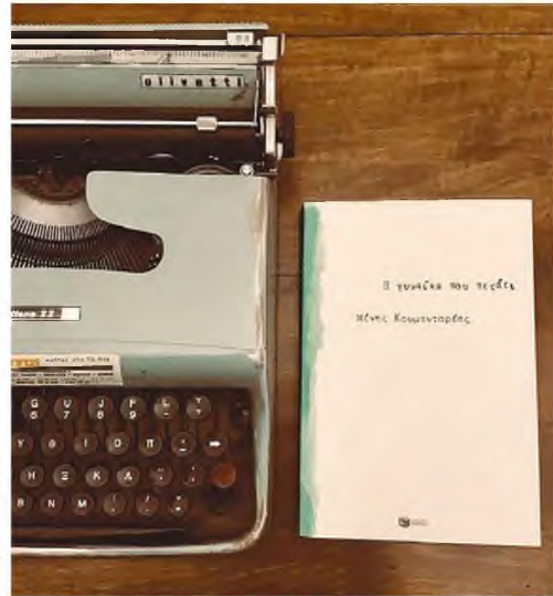
Η γραφομηχανή στην οποία έγραφε έχει συντηρηθεί και πάλι ένα ευρύτερο κοινό. Η γραφομηχανή στην οποία έγραφε έχει συντηρηθεί και έδωσε τη γραμματσοσειρά για τους τίτλους στα εξώφυλλα των βιβλίων του.