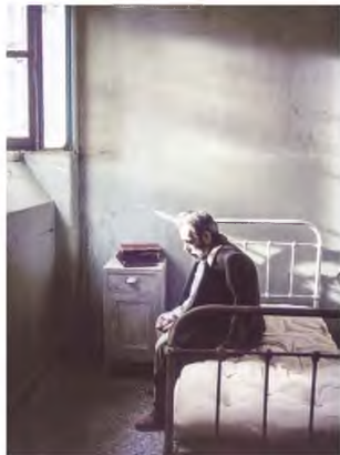
Φωτογραφίες από τις ταινίες του Λάκη Παπαστάθη «Θεόφιλος» (1987), «Ταξίδι στη Μυτιλήνη» (2010) και το «Μόνον της ζωής του ταξείδιον» (2001).