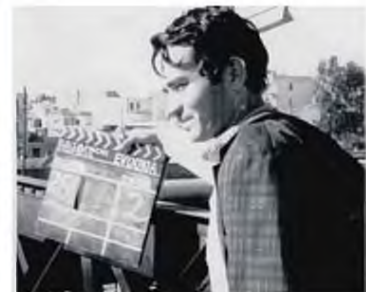
► Βονθός σκηνοθέτη στα γυρίσματα της «Ευδοκίας» (1971) του Αλέξη Δαμιανού