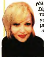
Συνέντευξη στη Σεμίνα ΑΙΓΕΝΗ

Το παιδί που γεννήθηκε στην Αθήνα, μεγάλωσε στη Ν. Σύμρνη, με ρίζες στη Σέρφο και στη Σύμρνη, από τα πέντε του χρόνια έβλεπε καθημερινά και για ώρες ταινίες στο σινεμά κι έτσι μυήθηκε από πολύ νωρίς στο μαγικό σύμπαν των παραμυθιών.