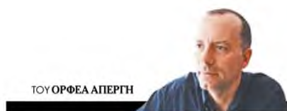
ΤΟΥ ΘΡΟΦΕΑ ΑΠΕΡΗ

Η Ομόνοια, ναι, εδώ νομίζω είναι το κλειδί - εξάλλου η πλατεία, πιθανώς ίσως και ο κεντρικός πίδακας νερού που βρίσκεται ακριβώς στο κέντρο της, βρίσκεται ακριβώς στο κέντρο του νοπτού σκαλνπού τριγώνου που σχηματίζουν οι τρεις διευθύνσεις του θείου. Η Ομόνοια είναι ο τρόπος, μαζί με τον θείο που τη συνοδεύει, να προσεγγίσω (αλλιώς δεν κατέστη για μένα δυνατόν) το τελευταίο βιβλίο του Χάρη Βλαβιανού. Το βιβλίο αυτό είναι μια σειρά ιστοριών παρ' ολίγον ομόνοιας, παρ' ολίγον καταγραφής στο σύστημα, παρ' ολίγον σωστές κι εμπρόθεσμης πληροφοριών φθόνων κι εκπλήρωσης όλων των ασφαλιστικών και λοιπών υποχρεώσεων ενός και μιας εκάστου εξ ημών