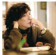
Η ποιήτρια Μαρία Λαϊνά τιμήθηκε για τη συνολική λογοτεχνική προσφορά της με το Μεγάλο Βραβείο Γραμμάτων.

Η ανακοίνωση των Κρατικών Λογοτεχνικών Βραβείων έγινε έπειτα από πολύμηνη καθυστέρηση, που οφείλεται σε νομοτεχνικά ζητήματα (σχετικά με την απαρτία της επιτροπής των βραβείων Λογοτεχνικής Μετάφρασης), τα οποία πάντως δεν είχαν αξιολογηθεί ως κρίσιμα από όλους τους εμπλεκόμενους («Κ», 2.5.2023). Στο μεταξύ, η θητεία όλων των επιτροπών βράβευσης έληξε