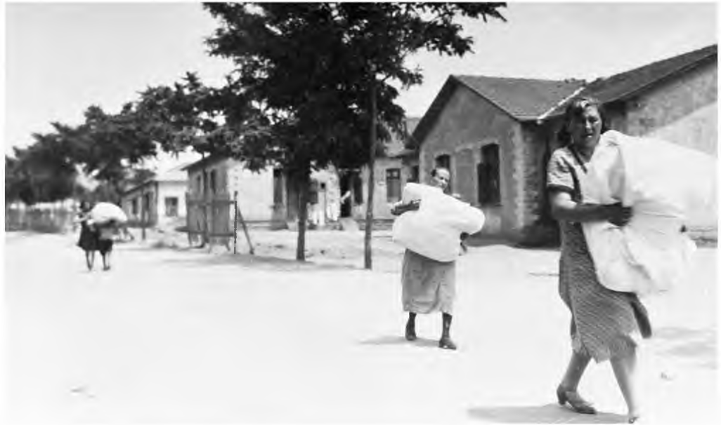
US Holocaust Memorial Museum

Έχουμε μια πραγματική τραγωδία που βιώνει ο Γόρδιος Κλήμεντος, ο κεντρικός ήρωας της ιστορίας. Μετρισαθής, ζει μέσα στην αντίφαση. Βιώνει και ζει μέσα στο δίλημμα, σε ένα τραγικό αδιέξοδο που προσπαθεί να το διαχειριστεί, αλλά δεν μπορεί. Σκεφτείτε ότι έχει ζήσει και στην Ευρώπη, άρα βιώνει την όλη αντίφαση ακόμη πιο έντονα. Αντιλαμβάνεται τι συμβαίνει με τους πρόσφυγες, το ίδιο και με τους εβραίους, προσπαθεί να κρατήσει τις ισορροπίες αλλά δεν τα καταφέρνει.