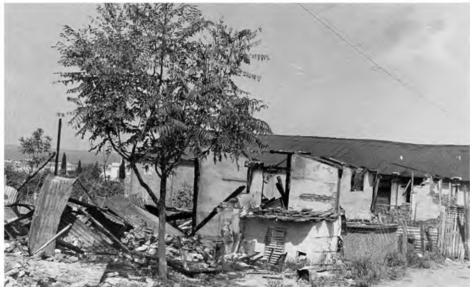
US Holocaust Memorial Museum

Το να γράφεις λογοτεχνία σημαίνει, κατά βάση, ότι προσπαθείς να