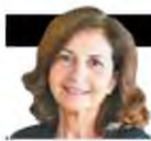
ΓΡΑΦΕΙ Η ΚΑΡΟΛΙΝΑ ΜΕΡΜΗΓΚΑ

Π ώς δικαιολογούνται 688 σελίδες μυθιστορίας; Συνήθως, δύσκολα. Είναι δύσκολο να μην περιέχουν πλατεϊασμούς, επαναλήψεις, φλυαρίες που αραιώνουν τους χυμούς μιας αφήγησης. Τα πρόσφατα «Μαθήματα» του ΜακΓιούαν δεν αποτελούν, κατά τη γνώμη μου, εξαίρεση. Και είναι κρίμα, γιατί η ραχοκοκαλιά της ιστορίας του είναι τόσο στιβαρή και πλούσια που δεν χρειαζόταν κανένα στήριγμα ή φάρδεμα. Από την πρώτη σελίδα, ο πρώτος σπόνδυλος: η κακοποίηση ενός μικρού παιδιού. Μια κακοποίηση που ανατρέπει τα στερεότυπα, καθώς θύτης είναι μια όμορφη 25χρονη δασκάλα πιάνου που φλέγεται από σαρωτικό ερωτικό πάθος για τον 14χρονο μαθητή της, κεντρικό ήρωα του βιβλίου. Το παιδί φυσικά κολακεύεται, γοητεύεται και υποκύπτει, και έτσι βυθίζεται σε μια σχέση εξουσιαστική, βασανιστική, καταστροφική, τα σημάδια της οποίας θα τον ακολουθήσουν σε όλη του τη ζωή. Τη ζωή που παρακολουθούμε εμείς.