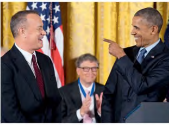
Στον Λευκό Οίκο, παραλαμβάνοντας το Προεδρικό Μετάλλιο Ελευθερίας από τον πρόεδρο Μπαράκ Ομπάμα, το 2016.

Όταν ήταν ακόμη παιδί, ο Τομ Χανκς έκανε συχνά μια τετράωρη διαδρομή με Λεωφορείο για να επισκεφθεί τη μητέρα του - οι γονείς του είχαν χωρίσει (στη φωτογραφία, σε ηλικία 10 χρόνων, το 1966). Το ταξίδι αυτό σπελυθερώσε κάτι μέσα του. Μερικές φορές διάβριζε λίγο, ίσως ένα κάμικ ή ένα βιβλίο, κυρίως όμως παρατηρούσε τον κόσμο που περνούσε από μπροστά του. Κάπως έτσι διαμόρφωσε τον ανήσυχον χαρακτήρα που τον οδήγησε στην υποκριτική και στην κατάκτηση δύο Όσκαρ (επίσης, με το βραβείο Α΄ ανδρικού ρόλου, το 1994, για την ταινία «Φλόαδερκρεισ»).