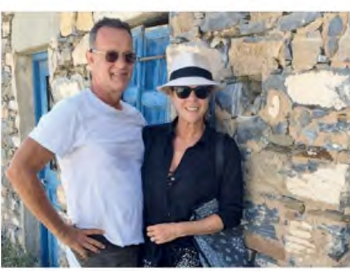
Η Ελλνοαμερικανίδα σύζυγός του Ρίτα Ουίλσον τον έκανε να αγαπήσει βαθιά την Ελλάδα. Κάθε καλοκαίρι επισκέπτεται την Αντίπαρο, όπου διατηρούν σπίτι, ενώ το 2019 του απονεμήθηκε τιμητικό α ελληνική θραυγένεια.

κα, αναδυόμενη με τα χρόνια καθώς εκείνος αποκότιουσε στάτους και αξιοσημεία. Δεν συνέβη όμως ακριβώς έτσι. Ήδη από τη δεκαετία του 1980 τον είχαν περιγράψει ως «έναν αστέιο και ευάλωτο κοινό άνθρωπο», «μια συμπαιθητική ψυχή χωρίς ίσχυρ ματαιοδοξίας», «μια εικόνα ενός σταθερά καλού άνδρα». Μάλιστα, ο ίδιος ασπίριζε στην εκπομπή «Saturday Night Live» το πόσο «αβερπαιευτα» καλός είναι.