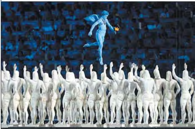
Στιγμιότυπο από την τελετή έναρξης των Ολυμπιακών Αγώνων του 2004 στην Αθήνα

Τα γεγονότα του Πολυτεχνείου η ίδια τα παρακολούθησε από την αμερικανική τηλεόραση αφού βρισκόταν σε ταξίδι στην Ουάσιγκτον, αλλά όσα ακολούθησαν μέχρι την πτώση της χούντας συνέχισαν να την απασχολούν όταν επέστρεψε στη Γαλλία. Την επιστροφή του Καραμανλή στην Ελλάδα, όμως, την είδε από κοντά, στην Ελλάδα πια, αφού η Φωτεινή είχε εκφράσει την επιθυμία της να γυρίσει στην Αθήνα έπειτα από μία δεκαετία δίπλα της στο Παρίσι. «Ήμουν εδώ με την κόρη μου, η οποία ήταν δέκα χρονών πάνω - κάτω. Καθόμουν στο σπίτι φίλων και περίμενα. Ο άντρας μου ήταν ακόμα στη Γαλλία. Η κόρη μου μου λέει "Μα εδώ πρέπει να είναι λίγο περίεργοι οι Έλληνες". Λέω "Γιατί". Μου λέει "Λένε «Ζήτω ο Καραμανλής», αλλά αυτή καταλάβαινε car a malis, δηλαδή φορτηγά γεμάτα πονηρία. Μετά έμαθα ότι είχαν τηλεφωνήσει και στον άντρα μου που ήταν στη Γαλλία, αν μπορεί να έρθει στην Ελλάδα. Ο δε Καραμανλής τότε στη Γαλλία κοιμότανε. Ήταν καλοκαίρι του 1974. Κοιμόταν και τον ξύπνησαν για να του πούνε να επιστρέψει. Ευτυχώς που ο Ζισκάρ ντ' Εστέν δεν κοιμόταν και του έδωσε το αεροπλάνο και ήρθε. Εγώ τότε ήμουν πολύ φίλη με τον Τάκη Λαμπρία, ο οποίος ήταν σχεδόν της ηλικίας μου, οπότε έζησα όλη τη θριαμβική είσοδο του Καραμανλή εδώ», συμπληρώνει η Ελένη Γλύκατζη Αρβελέρ.