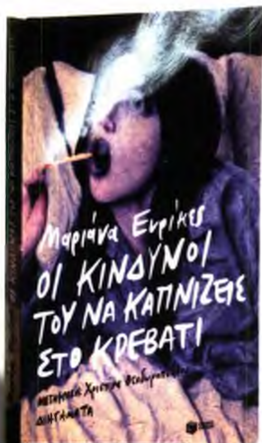
ΤΟ ΒΙΒΛΙΟ ΤΟΥ ΜΗΝΑ