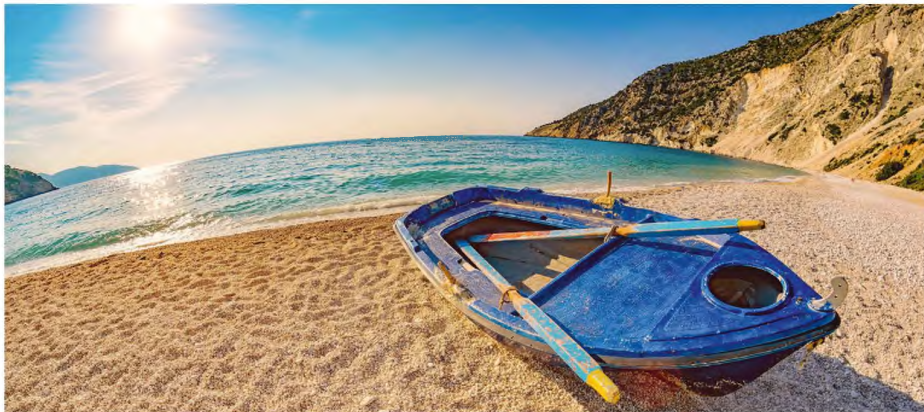
Η θάλασσα μαγεύει, ξεκουράζει, ξεσηκώνει, μα κρύβει μυστικά και ολόκληρα πλάσματα στα βάθη της.