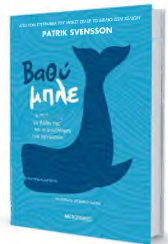
Τα επιστημονικά δεδομένα δίνονται οριστικά μέσα από μια μεστή, μέτρια αφήγηση.

Ο Μάγκρις είναι συγγραφέας με χιούμορ και λεπτή ειρωνεία, είναι επίσης ποιητικός χωρίς να έφευγεται σε εύκολους λυρισμούς. Τα αφηγήματα αυτά ταξιδεύουν τον αναγνώστη και την ίδια στιγμή τον επαναφέρουν γλυκά στο στιγμιαίο και στο μυστήριο του παρόντος.