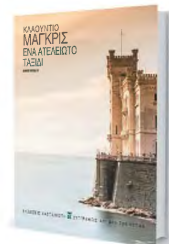
Ο Μάγκρις διαθέτει χιούμορ και λεπτή ειρωνεία, είναι ποιητικός χωρίς να πέφτει σε εύκολους λυρισμούς.