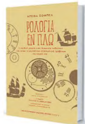
«Συμπρακτικό» αφήγηση για ένα επίτευγμα στους τομείς της μέτρησης του χρόνου και της ναυσιπλοΐας.