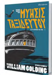
Στο «Μύθος ταξιδεύου», ένα σκαρί των αρχών του 19ου αιώνα ταξιδεύει από την Αγγλία στην Αυστραλία.