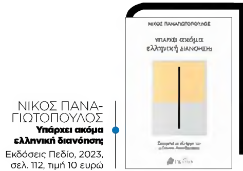
ΝΙΚΟΣ ΠΑΝΑΓΙΩΤΟΠΟΥΛΟΣ Υπάρχει ακόμα ελληνική διάνοηση; Εκδόσεις Πεδίο, 2023, σελ. 112, τιμή 10 ευρώ