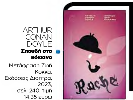
ARTHUR CONAN DOYLE Σπουδή στο κόκκινο Μετάφραση Ζωή Κόκκα. Εκδόσεις Διόπτρα, 2023, σελ. 240, τιμή 14,35 ευρώ