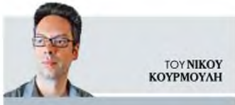
ΤΟΥ ΝΙΚΟΥ ΚΟΥΡΜΟΥΛΗΣ

Δ εν αρέσκειται «μες στες πολλές κινήσεις κι ομιλίες», «μες στην πολλή συνάφεια του κόσμου». Γι' αυτό και κάθε συνέντευξη μαζί της θεωρείται δύσκολη μέχρι να γίνει, απολαυστική – έως και καθαρτική – όταν πραγματοποιείται. Για τις τυπικές συστάσεις αρκεί να πούμε ότι η Μαρία Λαϊνά αποτελεί σήμερα μία από τις σημαντικότερες μορφές των νεοελληνικών γραμμάτων. Η ποιήτρια, θεατρική συγγραφέας και σεναριογράφος απέδωσε με το πυκνό όσο και λιπό ύφος της – που θρέφεται στο ημίφως, για τους γνωρίζοντες –, τη θρυμματισμένη μοναχικότητα του ατόμου εντός άσπεως. Την αναζήτηση των εγκάρσιων τομών του, πάνω στον έρωτα και τον θάνατο. «Φυσικά η φωνή είναι πολλές φωνές. / Κάποιες κατάφεραν να γίνουν ευδιάκριτες/ λίγες πιο δυνατά/ οι πιο πολλές θα μείνουνε στο χρώμα/ – βαλές ή ντάμα–», όπως έγραφε η ίδια το 1991.