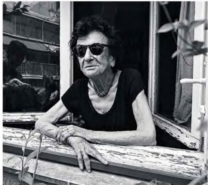
«Δεν ξέρω πώς θα ήταν αλλιώς η ζωή μου χωρίς την ποίηση και το θέατρο» λέει η βραβευμένη ποιήτρια

(*) Στίχοι από το ποίημα του Οδυσσέα Ελύτη: «Το Παράπονο» της συλλογής «Τα Ρω του Ερωτα», Ικαρος