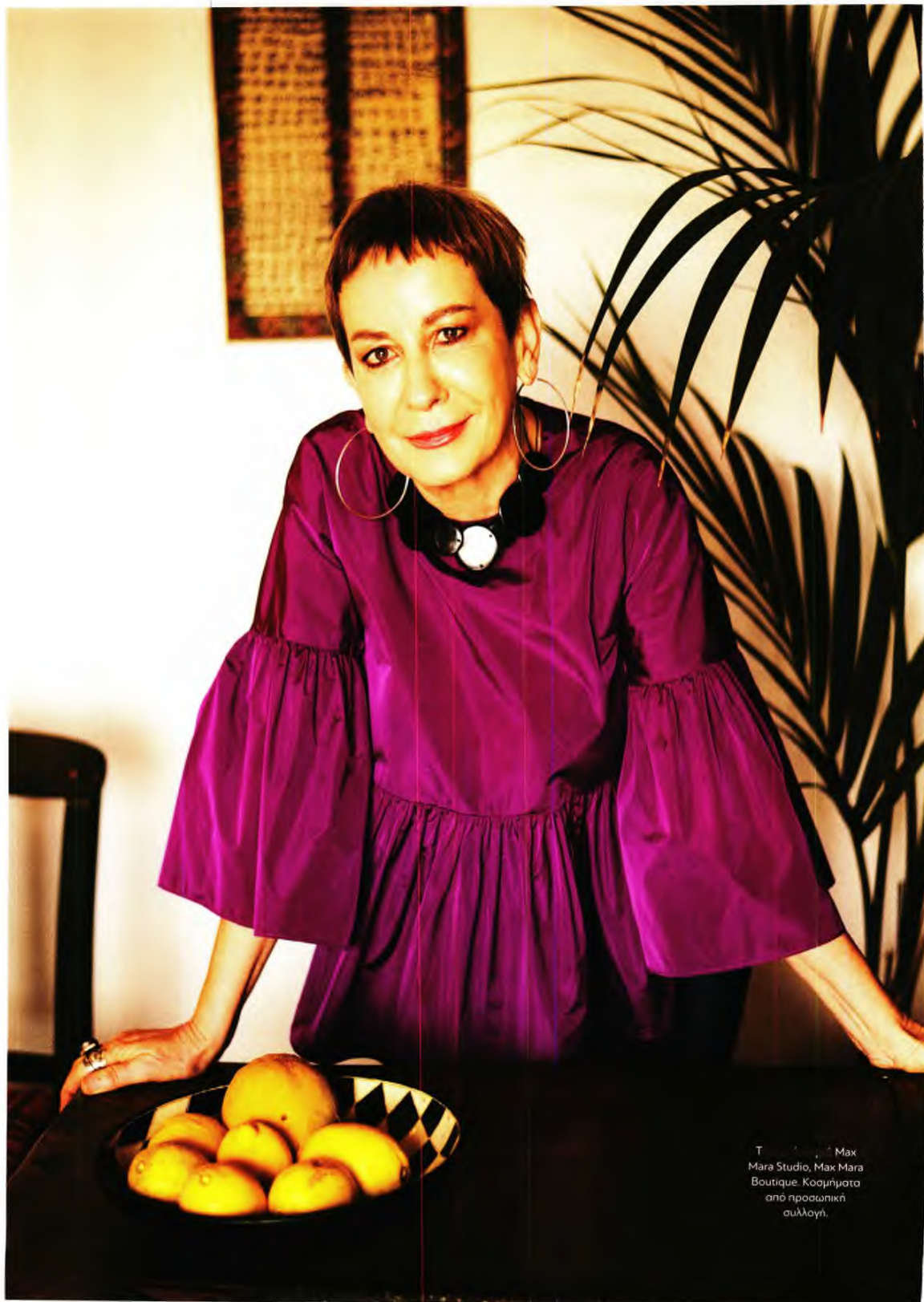
Το φούφολο της Max Mara Studio, Max Mara Boutique. Κοσμήματα από προσωπική συλλογή.