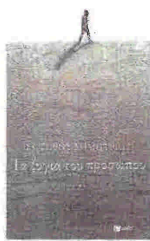
Σωτήρης Δημητρίου ΤΑ ΖΥΓΙΑ ΤΟΥ ΠΡΟΣΩΠΟΥ