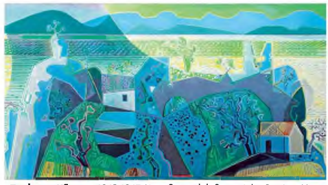
«Τοπίο της Υδρας» , 1963-1967. Η αναδρομική έκθεση «John Craxton. Μια ελληνική ψυχή» παρουσιάζεται στο Μουσείο Μπενάκη Ελληνικού Πολιτισμού.

Ανάμεσα σε αυτό το δίπολο ζυγίστηκε άλλωστε και ο βίος του Κράξτον, σε τέτοιο βαθμό