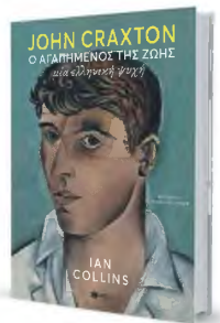
Το βιβλίο του Ιαν Κόλινς «John Craxton. Ο αγαπημένος της ζωής» κυκλοφορεί από τις εκδόσεις Πατάκη.

Ένα βιβλίο και μια έκθεση για τον αθεράπευτο λάτρη της χώρας μας Τζον Κράξτον