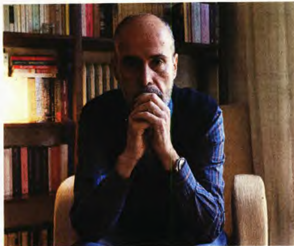
Γράφει ο Ξενοφών Α. Μπρουντζακης