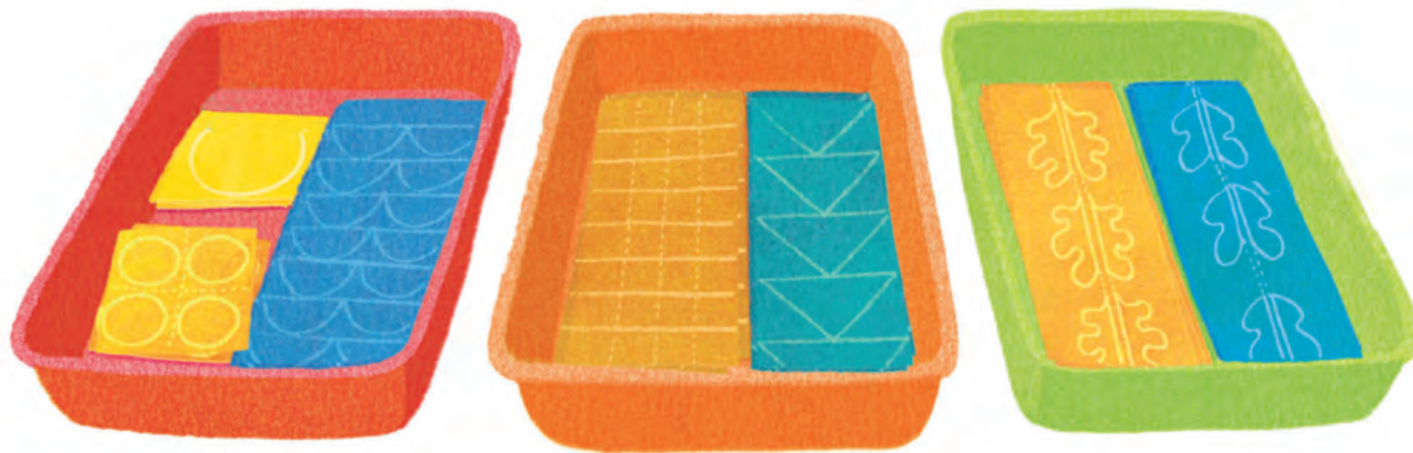
Δίσκοι για τις λωρίδες χαρτιών