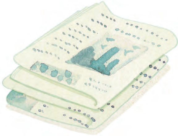
Εφημερίδες, περιοδικά, χαρτιά περιτυλίγματος