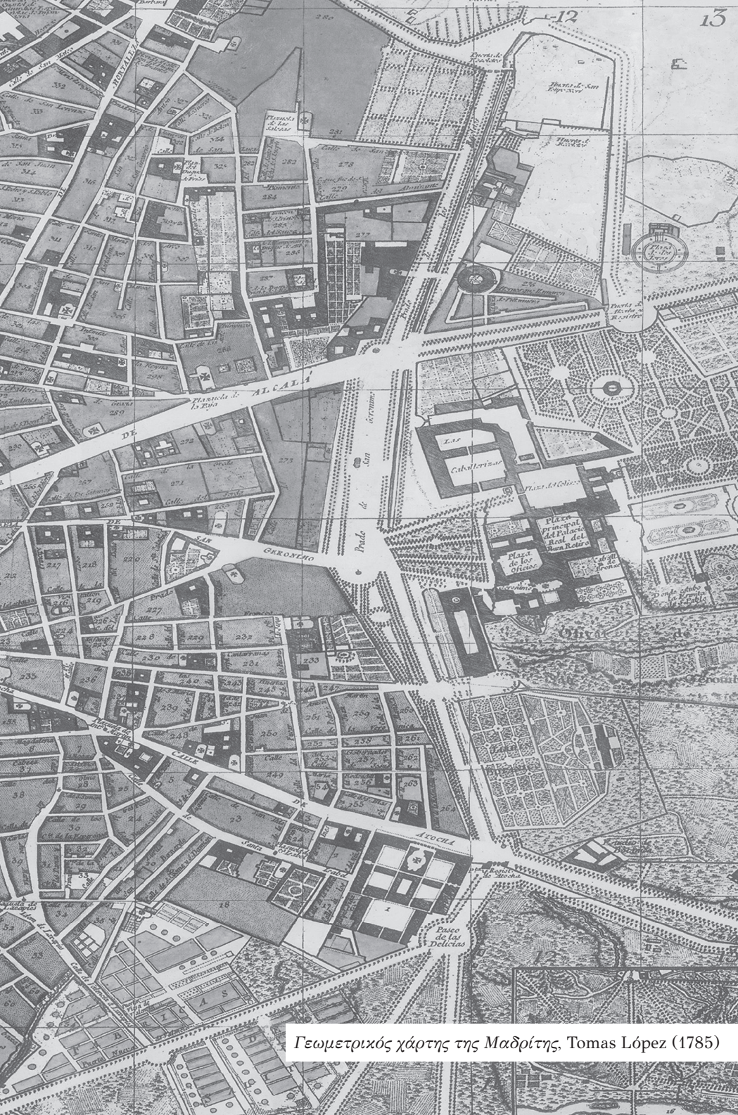
Γεωμετρικός χάρτης της Μαδρίτης, Tomas López (1785)