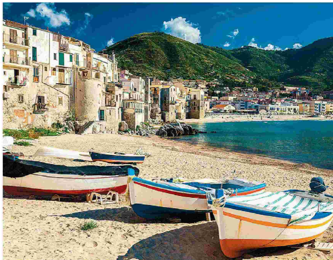
Η Βιγκάτα στη Σικελία, η γενέτειρα του επιθεωρητή Σάλβο Μονταλμπάνο, είναι μια φανταστική πόλη. Ωστόσο, οι περιγραφές του Αντρέα Καμιλλέρι την έχουν καταστήσει οικεία στους φανατικούς αναγνώστες του.

Η δεύτερη υπόθεση αφορά το παρόν. Μια ένοπλη επίθεση σε σχολική μονάδα, την άσκηση ψυχολογικής βίας σε εφήβους, τις παγίδες των μέσων κοινωνικής δικτύωσης για τους χρήστες τους. Αφορά έναν κόσμο που σφύζει από ζωή, δέσμιο όμως στον ιστό της σύγχρονης ηλεκτρονικής επικοινωνίας. Έναν κόσμο χωρίς δίκτυ ασφαλείας. Έναν καλά κρυμμένο κόσμο που ο Καμιλλέρι, μέσω της δράσης του Μονταλμπάνο, καταφέρνει να φέρει στην επιφάνεια για να αποδείξει ότι