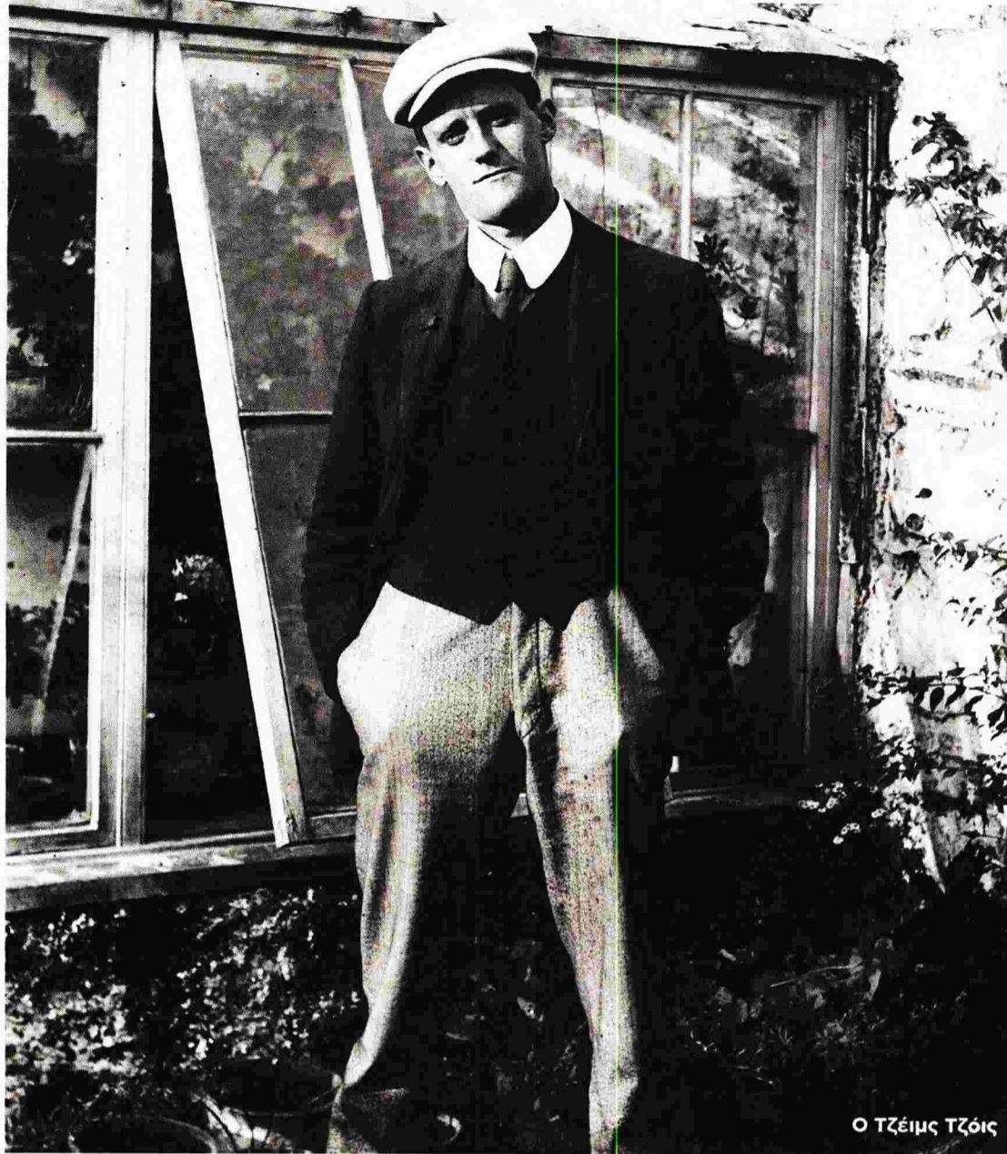
Ο Τζέιμς Τζόις