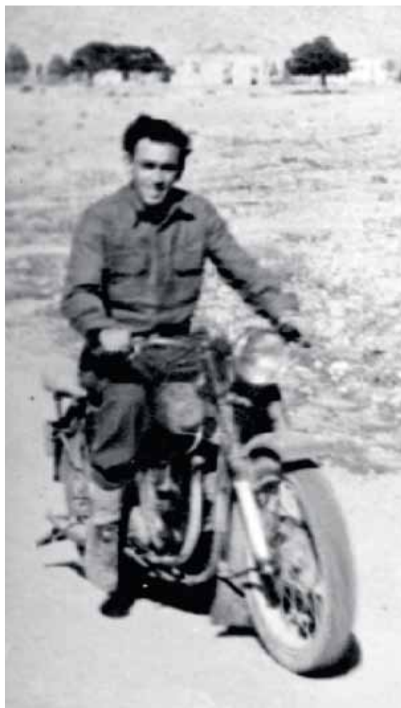
Με τη θρυλική μοτοσικλέτα από το Afrika Korps εξαιτίας της οποίας την τελευταία στιγμή και χάρη στη σωτήρια επέμβαση του Γρηγόρη Λαμπράκη δεν κατέληξε στην εξορία