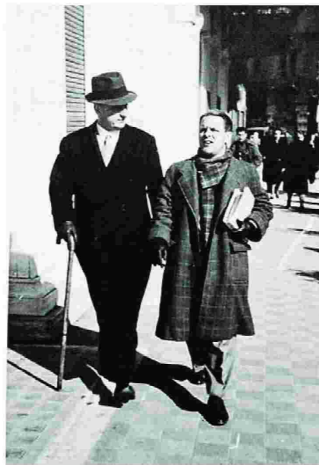
Ο Λόρενς Ντάρρελ στην Αθήνα με τον Γιώργο Κασιμάλη (αριστερά). Η οικογένεια Ντάρρελ στην Κέρκυρα, 1936 (δεξιά).

Αφήνοντας πίσω «τη γλυκιά ακτή της γιαγιάς Αγγλίας», η πολυπληθής φαμίλια των Ντάρρελ βίωσε το πέρασμα από την Ιταλία στην Ελλάδα σαν να διέσχιζε «μαγικές συντεταγμένες»: «Κάπου ανάμεσα στην Καλαβρία και στην Κέρκυρα ξεκινά πραγματικά το μπλε. [...] Συνειδητοποιεί κανείς μια αλλαγή στην καρδιά των πραγμάτων», έγραφε στο επόμενο βιβλίο του, τη «Σπλιά του Πρόσπερου», που είναι ολόκληρο αφιερωμένο στην Κέρκυρα. Οι Ντάρρελ –η Λουίζα και τα τέσσερα παιδιά της, ο Λόρενς (Λάρρυ), ο Λέζλι, η Μάργκαρετ (Μάργκο) και ο Τζέραλντ (Τζέρι)– έζησαν στο νησί σχεδόν μία πενταετία. Υπήρξαν μια οικογένεια παράξενη, και για τα ήθη της εποχής εκκεντρική. Δεν είναι τυ-