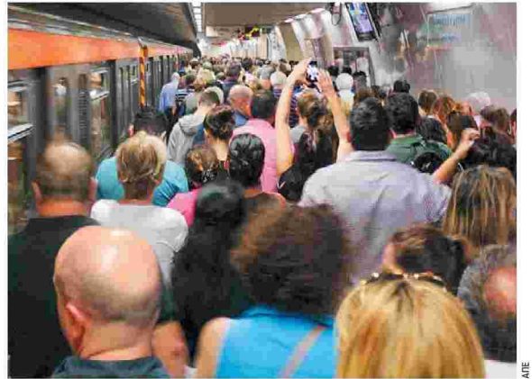
Ο συνωστισμός μπορεί να έχει δυσάρεστες συνέπειες.