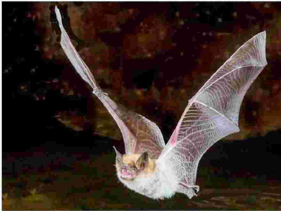
Κατηγορούμε τα ζώα, αλλά ο άνθρωπος φταίει για την πανδημία.

«Πρόκειται, βέβαια, για ένα παγκόσμιο φαινόμενο που παρατηρείται πλέον και στην Ελλάδα, ίσως διότι εδώ δεν είχαμε τόσες απώλειες. Δυστυχώς, πάνω στη θεωρία ότι ο ιός είναι είτε ανύπαρκτος είτε κατασκευασμένος σε εργαστήρια, έρχονται και κουμπώνουν και άλλα μυθεύματα, δημιουργώντας ένα επικίνδυνο μείγμα». Αραγε, η απουσία τήρησης των μέτρων που βλέπουμε γύρω μας και η υποτίμηση του κινδύνου πηγάζουν και από εκεί; «Οχι μόνο», απα-