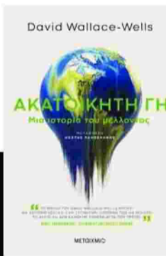
ΑΚΑΤΟΙΚΗΤΗ ΓΗ ΣΥΓΓΡΑΦΕΑΣ: DAVID WALLACE - WELLS ΕΚΔΟΣΕΙΣ ΜΕΤΑΙΧΜΙΟ

της θερμοκρασίας λαμβάνει χώρα μακριά μας και αφορά μόνο τον Αρκτικό Κύκλο. Τελικά οι αλλαγές στο επίπεδο της θάλασσας μας αφορούν ή όχι; Η καταστροφή του «φυσικού» κόσμου είναι απειλή για τον άνθρωπο; Ερωτήματα που απαντώνται με εξαιρετικά ιδιαίτερο και διεισδυτικό τρόπο που καταφέρνει να προκαλέσει ταυτόχρονα τρόμο αλλά και αισιοδοξία για το μέλλον.