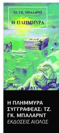
Η ΠΛΗΜΜΥΡΑ ΣΥΓΓΡΑΦΕΑΣ: ΤΖ. ΤΖ. ΜΠΑΛΑΡΝΤ ΕΚΔΟΣΕΙΣ ΑΙΟΛΟΣ

«Η ΠΛΗΜΜΥΡΑ» του συγγραφέα της «Αυτοκρατορίας του Ηλίου» κι ενός από τους πολυγραφότατους Βρετανούς συγγραφείς του δεύτερου μισού του 20ού αιώνα περιγράφει μια φυσική καταστροφή. Τα πρόσωπα ζουν σε ένα πλημμυρισμένο Λονδίνο που έχει αλλάξει το τοπίο, τον τρόπο ζωής τους αλλά και την ψυχική τους κατάσταση και τις σχέσεις τους. Ο ήρωας εντούτοις όχι μόνο αποδέχεται τις κατακλυσμιές βροχές που πλημμυρίζουν τον κόσμο σαν αναπόφευκτο φυσικό φαινόμενο, αλλά μοιάζει να συμφιλιώνεται μαζί τους, αν όχι και να «συνωμοτεί» για να επιβιώσει. Οι περιγραφές του πλημμυρισμένου Λονδίνου είναι εντυπωσιακές. Μέσα σ' αυτό το τόσο αλλόκοτο τοπίο οι ανθρώπινες συγκρούσεις παίρνουν άλλη διάσταση, τα συναισθήματα και οι αντιδράσεις των προσώπων είναι αιχμάλωτα του νερού.