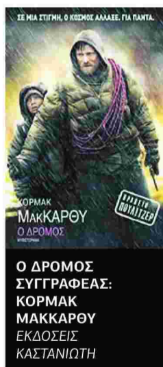
Ο ΔΡΟΜΟΣ ΣΥΓΓΡΑΦΕΑΣ: ΚΟΡΜΑΚ ΜΑΚΚΑΡΟΥ ΕΚΔΟΣΕΙΣ ΚΑΣΤΑΝΙΩΤΗ

ΜΕΤΑ από μια βιβλική καταστροφή που έχει αφανίσει τα πάντα, ένας άντρας και ο μικρός γιος του διασχίζουν μια ερειπωμένη χώρα σέρνοντας ένα καρτόκι με πράγματα που αποτελούν τη μόνη τους περιουσία. Σκοπός τους να φτάσουν στη θάλασσα. Στο τραγικό φινάλε του ταξιδιού τους μια νέα μέρα, μια νέα χώρα, μια νέα ζωή θα φανεί στον ορίζοντα. Το νέο μυθιστόρημα ενός από τους σημαντικότερους σύγχρονους Αμερικανούς συγγραφείς που βραβεύτηκε με το βραβείο Πούλιτζερ 2007 και γυρίστηκε σε ταινία από τον Τζον Χίλκοουτ είναι μια επική αλληγορία για το μέλλον του ανθρώπου και την κλιματική αλλαγή, ανοίγοντας στο τέλος μια χαραμάδα φωτός.